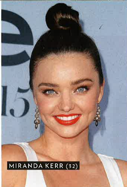
MIRANDA KERR (32)