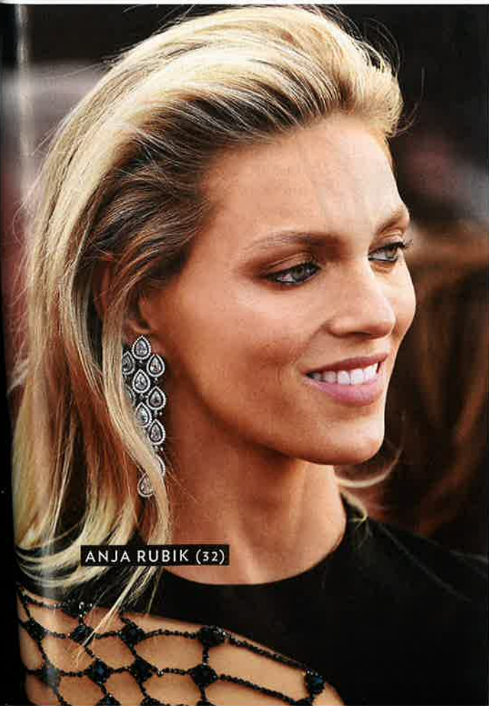
ANJA RUBIK (32)

Handtrockene Haare durchkämmen, die Oberkopfpattie abteilen. Das Föhnspray vom Ansatz an in die Längen des Resthaars sprühen und partienweise über eine Rundbürste föhnen. Die gleiche Prozedur mit der Oberkopfpattie weiterführen und das Deckhaar antoupiieren. Dann die Ponypartie darüberkämmen und in Form legen. Großzügig mit Haarlack besprühen. Wer von Natur aus fülliges Haar hat, kann nur mit Stylingspray und Toupierkamm arbeiten.